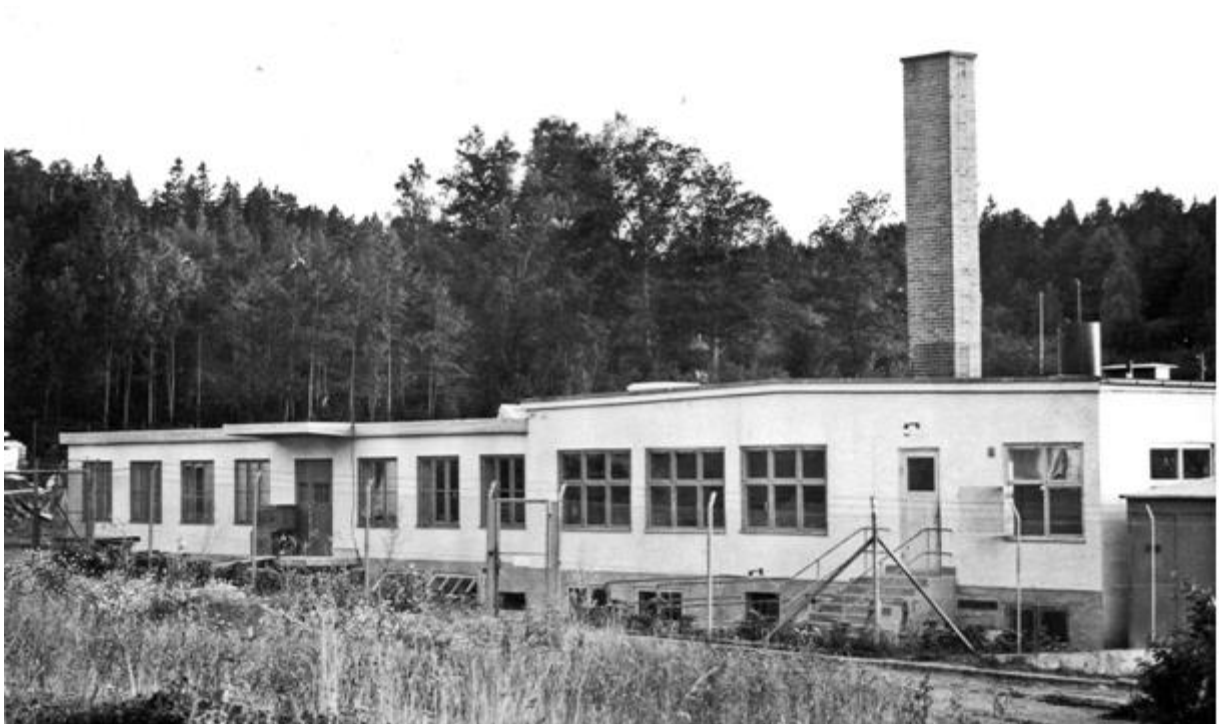
Stjernqvist metallfabrik vid Hedlandets station efter nybyggnad omkr. 1936